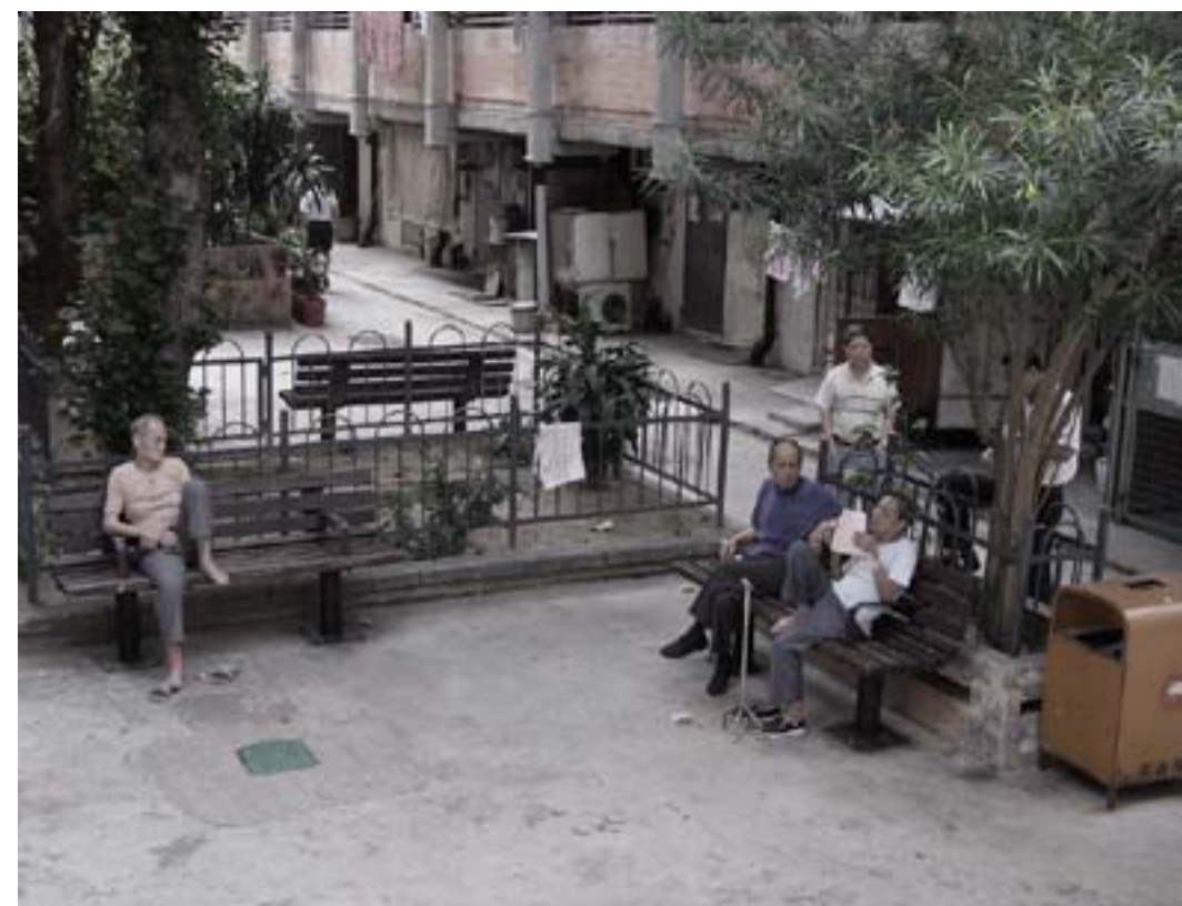
18 Αθ. Παρασκευόπουλος, Graffiti, Διεκδικώντας μια θέση στην αστική πραγματικότητα, 2008, Δ.Π.Θ.

Εδώ οι πολιτισμικές διαφορές δεν διαδραματίζουν τόσο σημαντικό ρόλο στην διαμόρφωση του χώρου, όσο το υπόβαθρο πάνω στο οποίο αυτές εκδηλώνονται. Και στις δύο αυτές περιπτώσεις, δημιουργείται ένα ιδιότυπο καθιστικό διαφορετικού χαρακτήρα –στο οποίο οι ομάδες αναπτύσσουν κοινωνικές επαφές μεταξύ τους, και περνούν αρκετό χρόνο της ημέρας –το ένα συγκεντρωμένο και το άλλο διασκορπισμένο κατά μήκος του δρόμου.